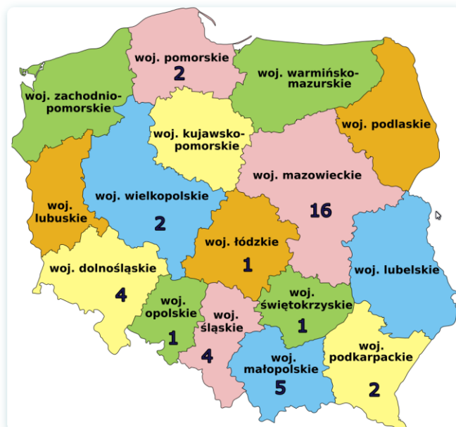
Diagram: Uczestnicy kursów języka polskiego w miejscu zamieszkania

Kursy językowe realizowane były przez ORPEG w miastach, które wskazywali repatrianci w Ankiecie zgłoszeniowej na kurs językowy .